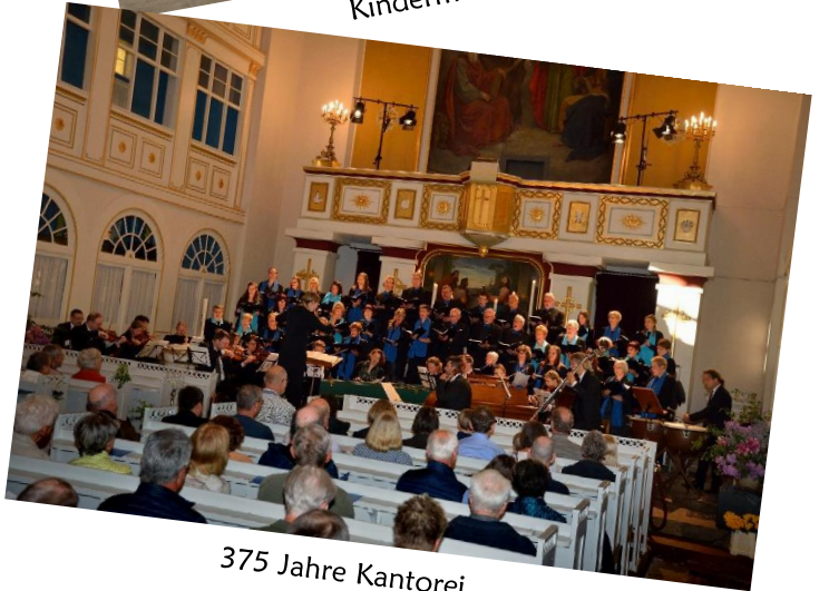
375 Jahre Kantorei