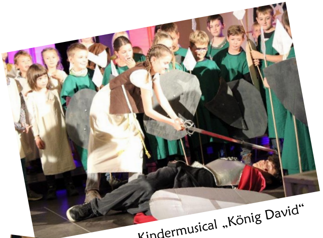
Kindermusical „König David“